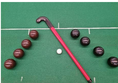
1 e plaats: Team Sprundel

Alle foto's (in kleur) zijn te vinden op onze website: www.kbo-oudgastel.nl